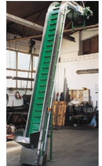
Steilförderer für Kleinteile