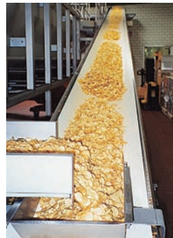
Förderbänder für Lebensmittel