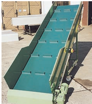
Steilförderband für leichtes, voluminöses Stück- und Schüttgut