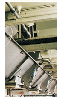
Verteilschnecke mit Verschiebeausläufen