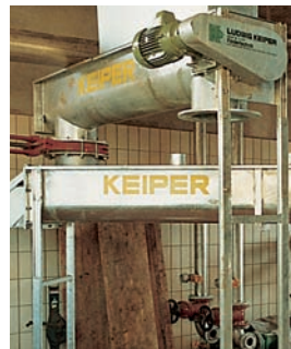
Misch- und Siloaustragschnecke