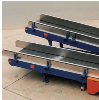
Gleitgurtförderer mit Materialführungsleisten