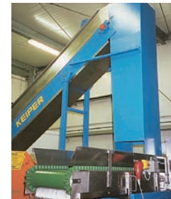
Schüttgut-Förderanlage mit Wellkantengurt inkl. Bürstenreinigung