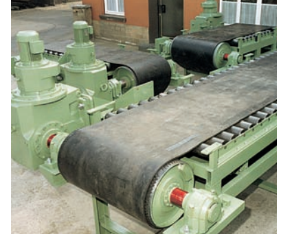
Schwerlast-Abzugsbänder mit Spezialgetriebe