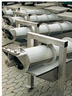
Rohrschneckenförderer in Sonderausführung