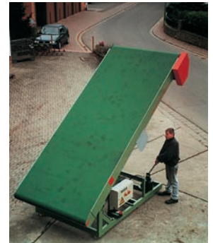
Breitgurtförderer, hydraulisch höhenverstellbar

Weitere Produktfotos unter www.keiperkg.de