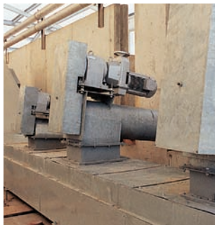
Rohrförderschnecken in der Klärschlammaufbereitung

Weitere Referenzanlagen unter www.keiperkg.de