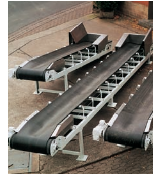
Muldenbandförderer auf Tragrollenstationen