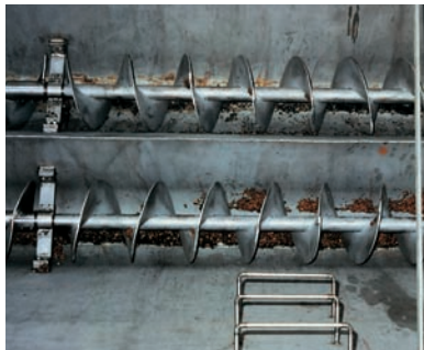
Silo-Austrag mit V2A-Doppelschnecke