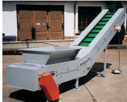
Knickbandförderer mit PVC-Stollengurt und Aufgabetrichter