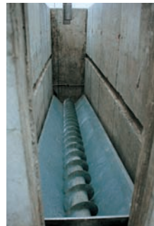
Bunker mit Austragschnecke