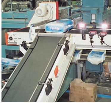
Stückgut-Transportanlage mit Ausschleusung u. Lichtschrankensteuerung

Weitere Produktfotos unter www.keiperkg.de