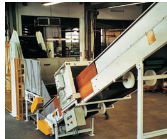
Stollengurtförderer mit Kippvorrichtung und Metall-Suchspule