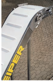
Schrägförderer aus V2A m. Gurt-Schnellspanner