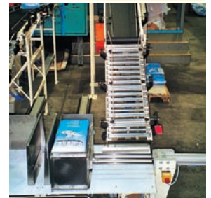
Stückgut-Transportsystem inkl. Steuerung, Rollenbahnen und Ausschleusevorrichtung

Weitere interessante Varianten unter www.keiperkg.de