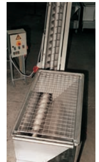
Edelstahlbehälter mit Schneckenaustrag

Weitere Referenzanlagen unter www.keiperkg.de