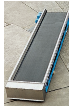
Förderband mit rollenabgetr. Gummigurt