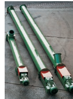
Rohrschneckenförderer mit Ein- u. Auswurf-flansche