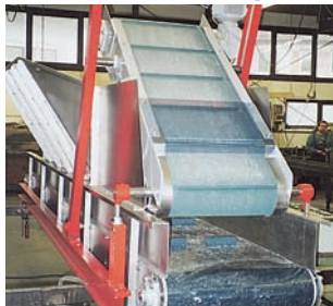
Produkt- Auflöse, Egalisierungs- bzw. Anpress- Fördersystem

Weitere interessante Varianten unter www.keiperkg.de