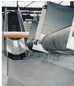
Förderstrecke mit Kastenbeschicker und Metallsuchspule