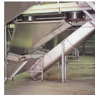
V2A-Trogförderschnecken in der Traubenverarbeitung