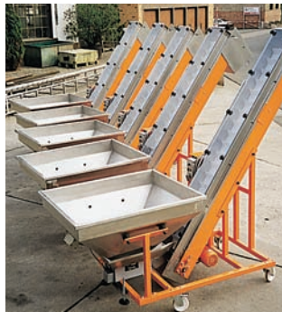
Maschinenbeschickungsbänder mit Vorratsbunker u. Vibro-Rinne