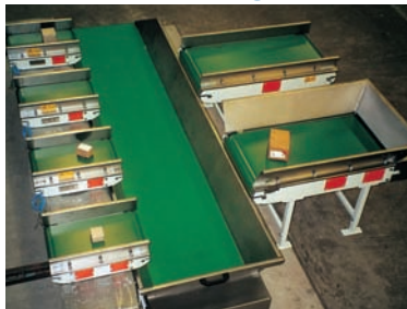
Fördersystem für Stückgüter