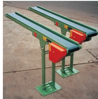
Kleinförderbänder für leichtes Stückgut