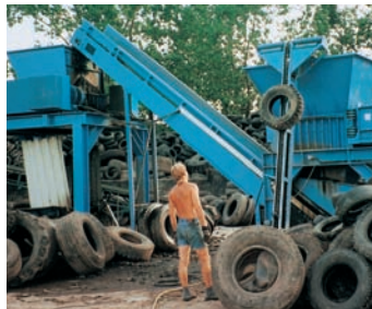
Shredderbeschickungssystem mit Reifenlift und Förderband