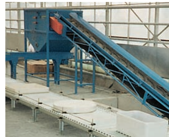
Schüttgut-Transportsystem mit Dosierbunker und angetr. Rollenbahn