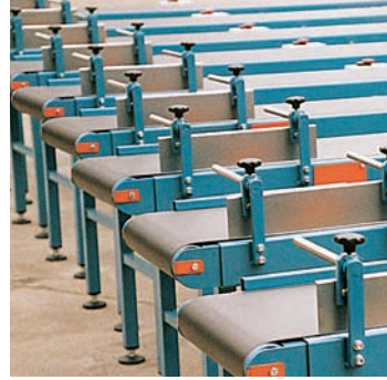
Serien-Gleitgurtförderer mit verstellbarem Aufgabe-Anschlag