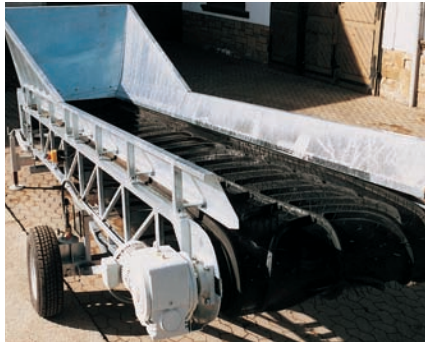
Schweres Universalförderband, fahrbar, hydraulisch höhenverstellbar